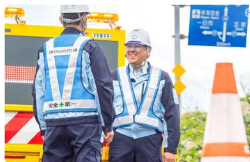
T. U 上越支店 次長／2007 年中途入社